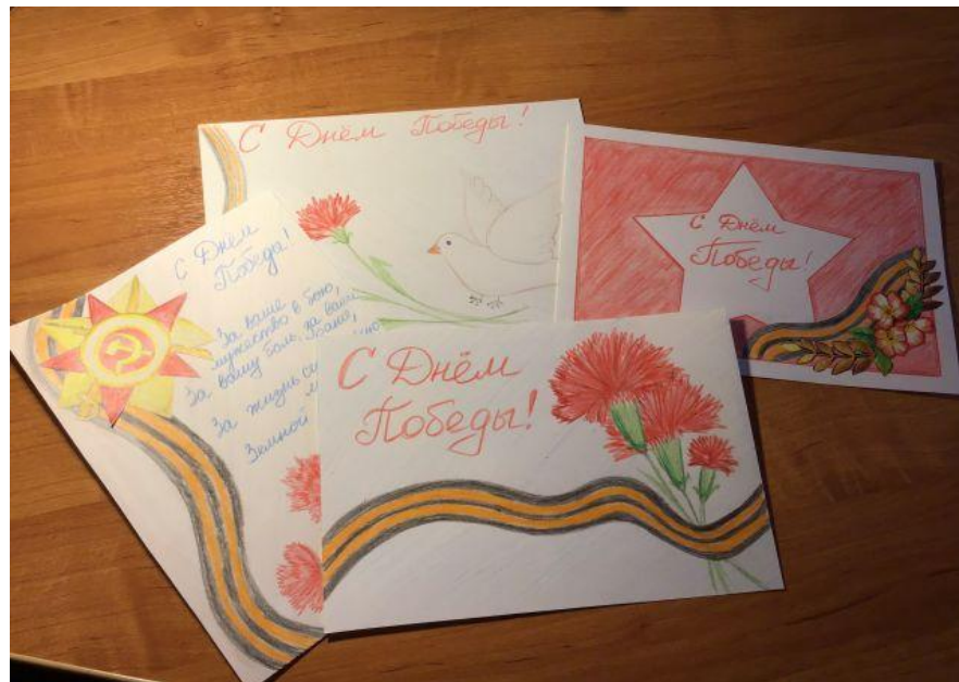
Открытки ко Дню победы