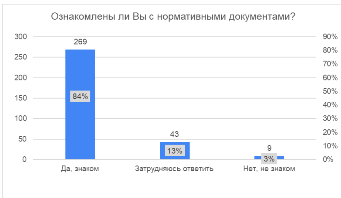
Рисунок 2. Ответы на вопрос об ознакомлении родителей с нормативной документацией

На рисунке 2 представлены результаты ответов на вопрос «ознакомлены ли Вы с нормативными документами?».