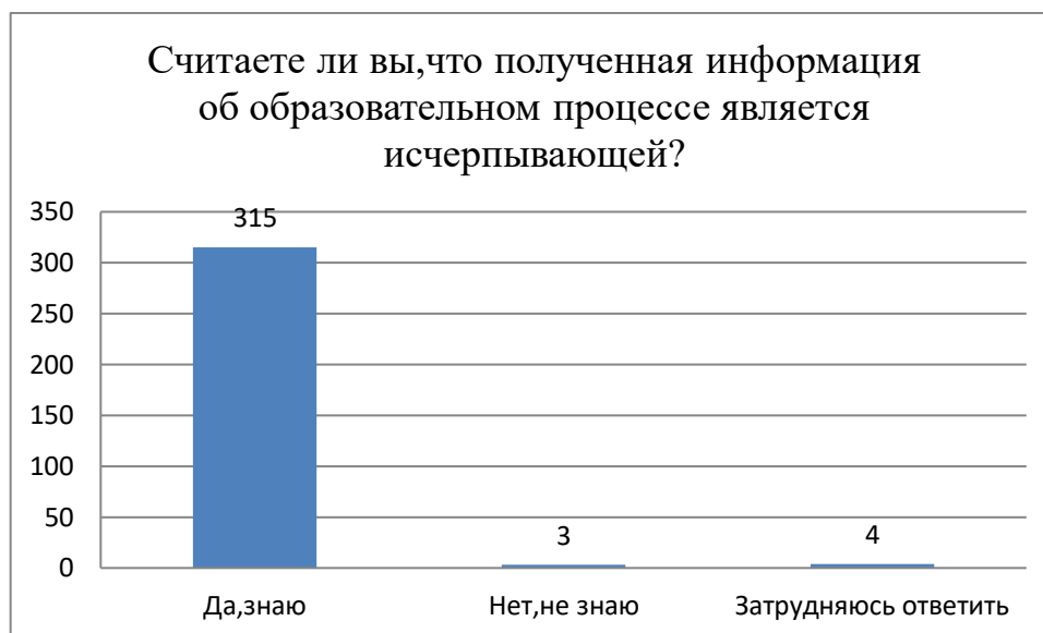
Рисунок 4. Ответ на вопрос «считаете ли Вы, что полученная информация об образовательном процессе является исчерпывающей?»

Данные о качестве информирования родителей об образовательном процессе представлены на рисунке 4.