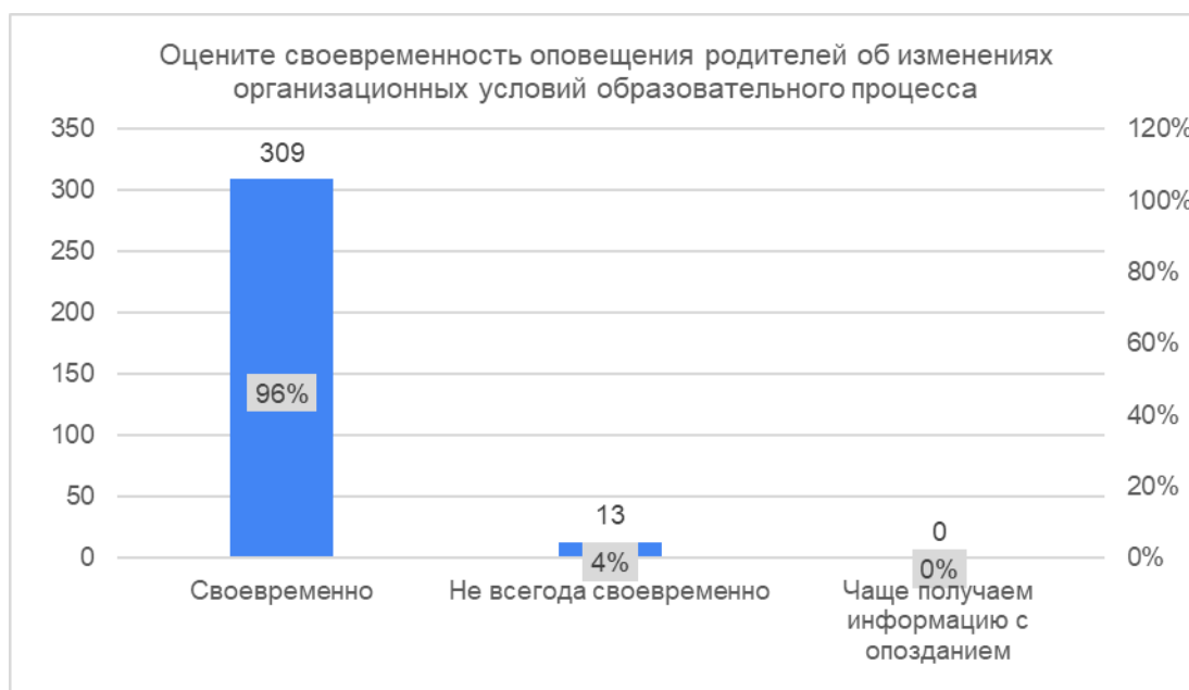
Рисунок 3. Оценка своевременности обратной связи для родителей

Рисунок 3 содержит информацию об отношении родителей учащихся к своевременности обратной связи.